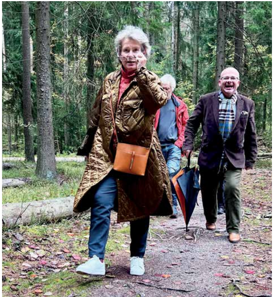
Laget Martin och juristerna i antågande till kontroll 5.

Vill du lägga dig i träning för nästa gång? Några frågor utlovas då om sånt som står och stått i Aveiten med början från år 2023.