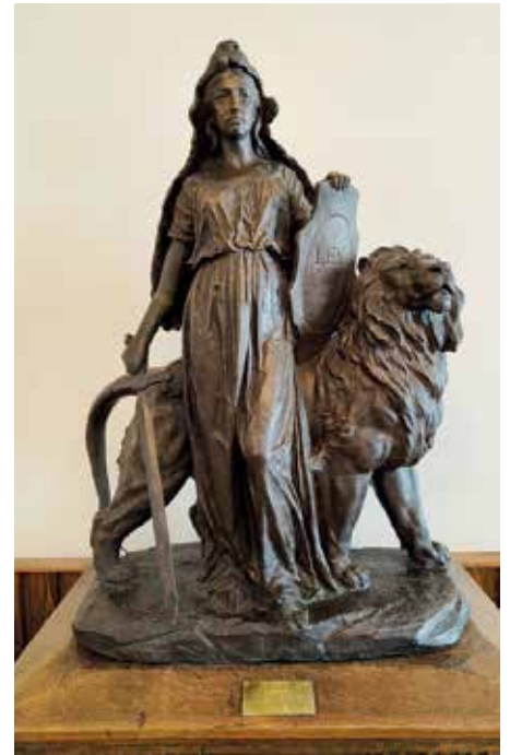
Nyrenoverad Lex Patria.