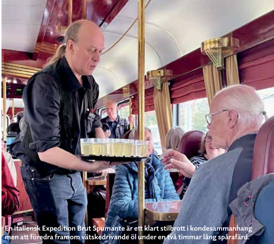
En italiensk Expedition Brut Spumante är ett klart stilbrott i kondesammanhang men att föredra framom vätskedrivande öl under en två timmar lång spårafärd.