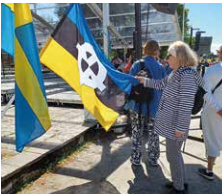
Aibolands egna flagga.