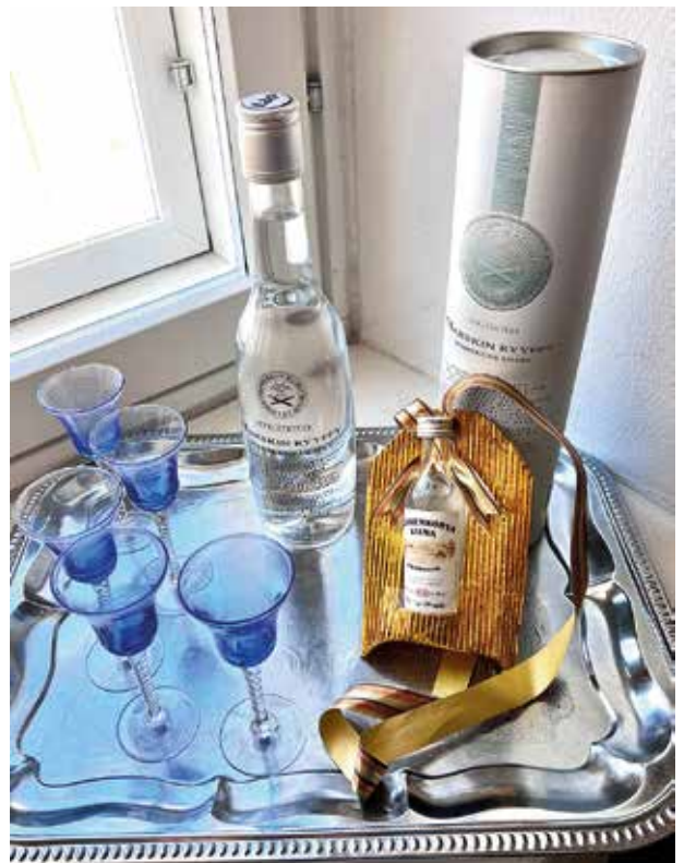
Vinsterna som sparats i 18 år sedan Snapsvisetävlingarna på AV.

Skål för oss alla goda drycker kallar Här får vi vara en präktiger skara sjunga och käka och nubben ta!