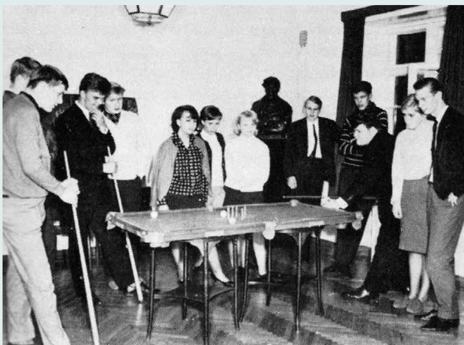
Den nybildade ungdomskretsen vid biljardbordet år 1965. Ungdomskretsen erbjöd spel, film, diskussioner, frågesport och danskurser. Fotot finns i föreningens 100-årshistorik.