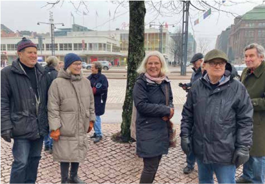
19 deltagare, AV-medlemmar och vänner, deltog på teaterresan till Fallåker.