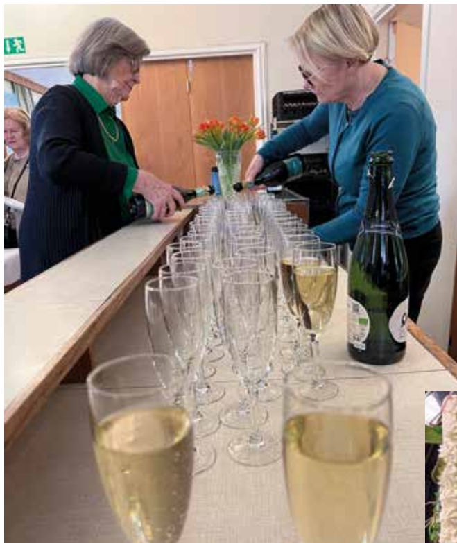
Bubbel för 70 festdeltagare, den alkoholfria andelen ökar.

Under festtalet har publiken suttit andlöst stilla och tyst. Det gavs mycket att begrunda. Lyckligtvis kallades alla man till pausserveringen, som denna gång bestod av skumvin och smörgåstårter av många oli-