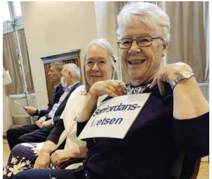
Till vänster Vox Senioras och på bilden till höger seniordansens deltagare i årets frågesport.