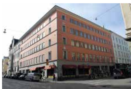
På bilden överst det gamla föreningshuset på Annegatan 26. Planritning på det gamla föreningshuset 1908. Till höger dagens föreningshus, som togs i bruk 1929.

fram ett förslag att bebygga den delen av tomten där det nu fanns ett lider. Förslaget lades till de övriga byggnadsprojekten.