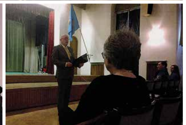
Några bilder på kretsarnas verksamhet 2017.