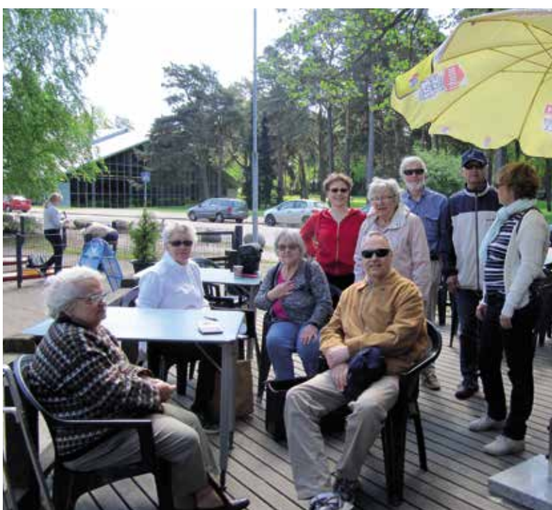
Minigolftävlingen spelades i soliga men något blåsiga Edesviken. Fyra lag deltog.