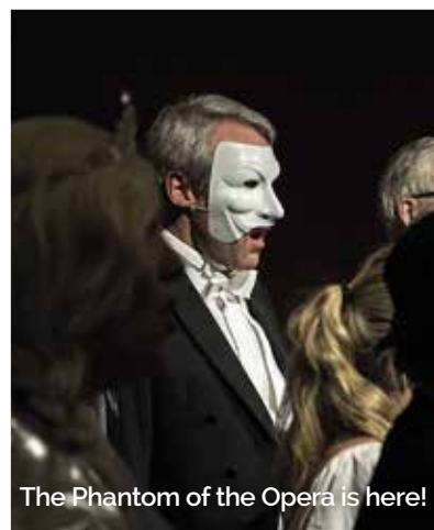
The Phantom of the Opera is here!