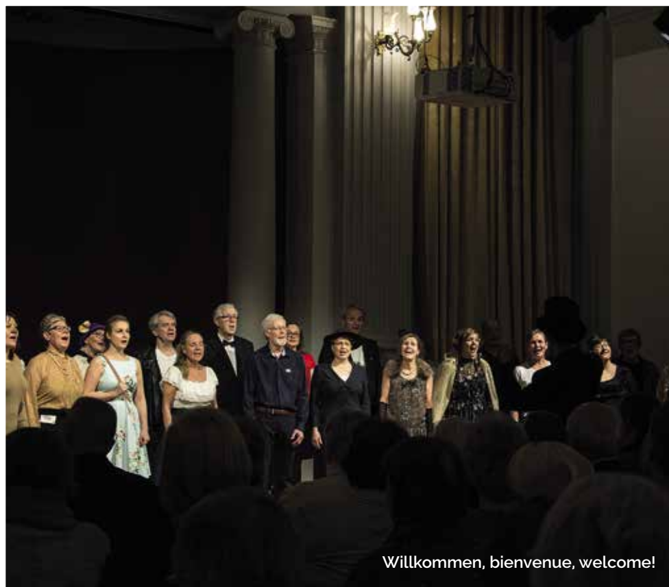
Willkommen, bienvenue, welcome!

– Förr stod läraren bakom katedern och undervisade, nu är läraren mera en handledare. Skolans kontakt både med eleverna och hemmen är tätare och sker i hög grad