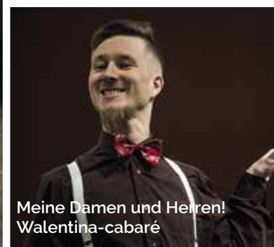
Meine Damen und Herren! Walentina-cabaré