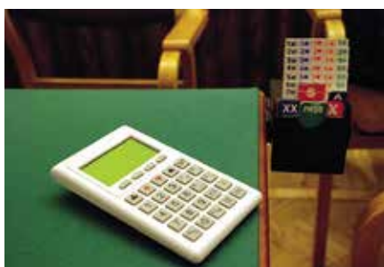
Med modern teknik matas resultaten direkt ut på Internet. Bridgeklubben tog i bruk kortutdelningsmaskinerna år 2013.