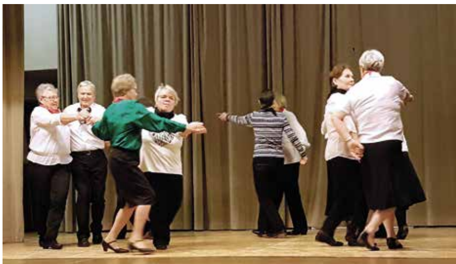
På årsfesten stod flera kretsar för programinslag. På bilden uppträder Senior-dansklubbens medlemmar.