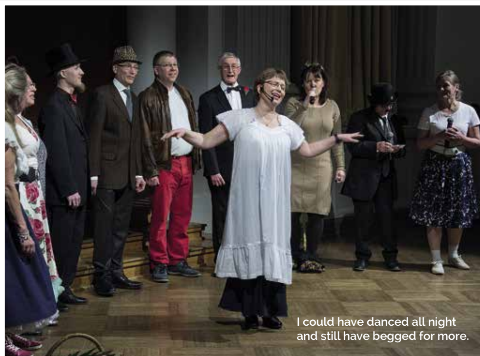
I could have danced all night and still have begged for more.