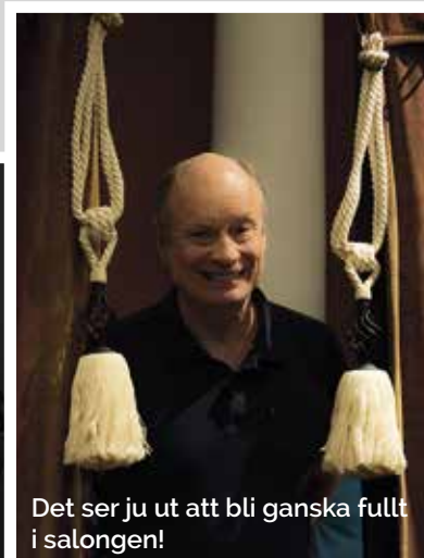
Det ser ju ut att bli ganska fullt i salongen!