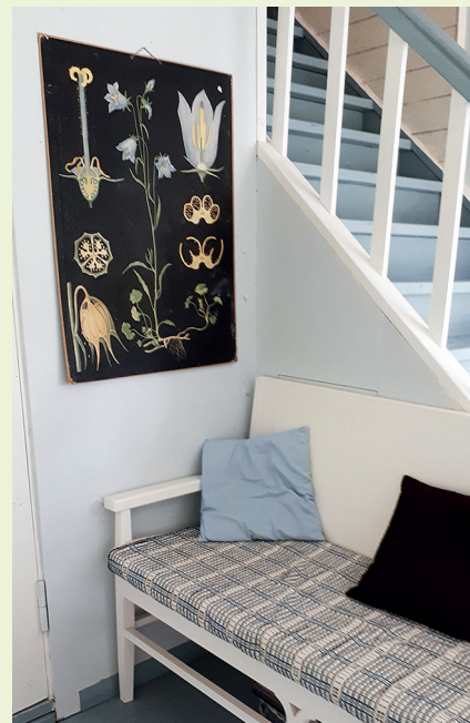
På bilden till vänster Ebba Masalins målning. På den högra bilden en av Masalins växtplanscher.